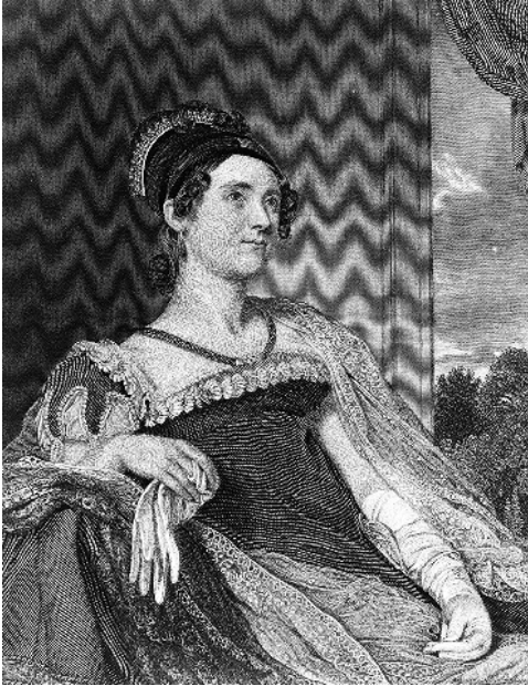
Louisa Adams, (Mrs. John Quincy Adams), 1852.

De wegen werden vanaf Königsberg en Berlijn steeds beter. ‘Tot mijn grote verbazing,’ schreef Louisa ter hoogte van Berlijn, ‘hoorde ik hier niets dan lofprijzingen op de daadkracht van Napoleon.’ De bevolking aldaar verzekerde haar dat ze hier ‘over de mooiste wegen in de wereld reisde, die op zijn bevel [dat van de keizer] waren voltooid’. 2