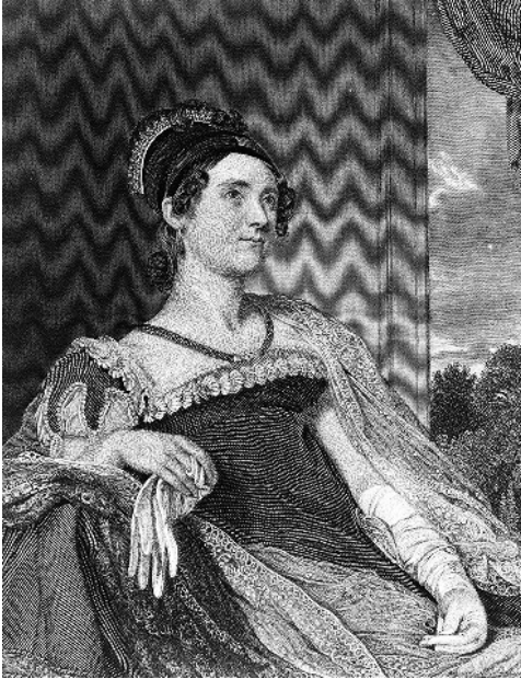
Louisa Adams, (Mrs. John Quincy Adams), 1852.

De wegen werden vanaf Königsberg en Berlijn steeds beter. ‘Tot mijn grote verbazing,’ schreef Louisa ter hoogte van Berlijn, ‘hoorde ik hier niets dan lofprijzingen op de daadkracht van Napoleon.’ De bevolking aldaar verzekerde haar dat ze hier ‘over de mooiste wegen in de wereld reisde, die op zijn bevel [dat van de keizer] waren voltooid’. 2