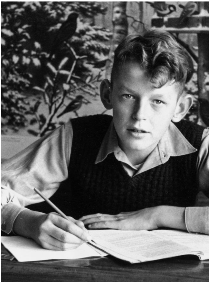
LEERLING VAN DE OPENBARE LAGERE SCHOOL IN BERGAMBACHT.