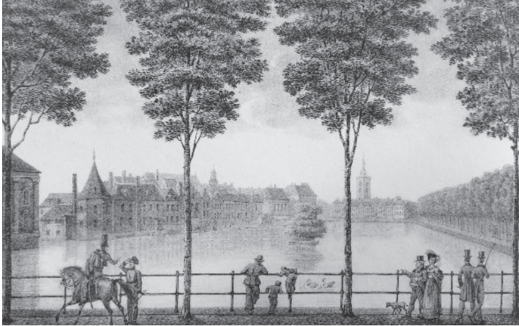
Gezicht op het Binnenhof te Den Haag, omstreeks 1825.