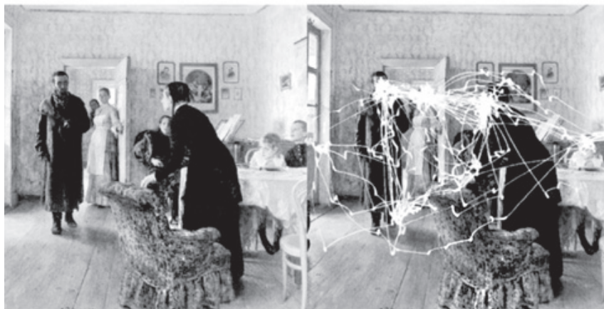
Figuur 1.3. Oogbewegingen stellen ons in staat om onze blik telkens op andere punten in ons gezichtsveld te richten. Als een proefpersoon het schilderij (links) bekijkt, bewegen onze ogen zich snel van het ene deel van het plaatje naar het andere (rechts; witte lijnen en stippen), waarbij opvalt hoe vaak onze blik blijft hangen bij interessante onderdelen zoals gezichten en handen. 15

Het integrerende vermogen van de hersenen geldt voor alle zintuigen die bijdragen aan een ervaring, zoals wanneer we de woorden van een gesprekspartner verstaan vanuit een combinatie van visuele lipbewegingen en geluiden. Wat we horen, wordt niet alleen bepaald door geluidsgolven die ons oor bereiken, maar ook door wat we zien. Hierbij laten de hersenen zich gemakkelijk voor de gek houden. Kijken we naar een buikspreker met op zijn schoot een pop die zijn lippen beweegt, dan ervaren we de illusie dat de gesproken woorden uit de mond van de pop komen. Onze hersenen smeden twee losse inputs – de geluiden en de visuele lipbewegingen – samen tot één enkele ervaring, niet een interpretatie die uit twee losse ervaringen bestaat.