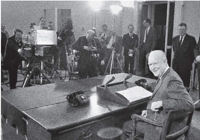
Eisenhower houdt zijn afscheidstoespraak als president, 17 januari 1961

Al was de term militair-industrieel complex nieuw, de woorden van Eisenhower deden denken aan die van George