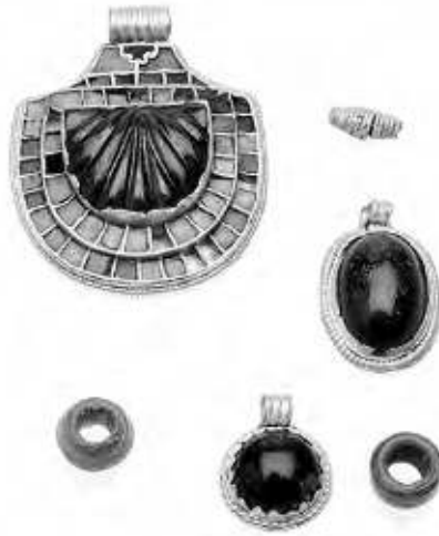
Hangers van goud en granaat uit graf 42, Street House, Loftus.

granaat in de vorm van een jakobsschelp van bijna 2 centimeter breed. Iets dergelijks was nog nooit gevonden en het suggereerde dat de in graf 42 geëerde persoon erg belangrijk was – waarschijnlijk iemand uit een koninklijke familie of de adel. Het suggereerde ook dat ze een vrouw was. 8