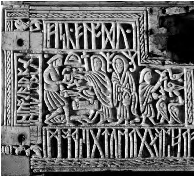
Afbeelding van de smid Wieland op de voorkant van de Franks Casket, British Museum

In de zevende eeuw zag men smeden als machtige en belangrijke leden van de samenleving. Dit was een overblijfsel van de Germaanse heidense religie die in heel Engeland werd gepraktiseerd voor de komst van christelijke missionarissen. Een gevierde mythische figuur was de smid Wieland. In de Poëtische Edda staat zijn verhaal. Wieland was zo'n geweldige sieraadmaker dat koning Níðuðr hem als slaaf wilde, zodat verder niemand de