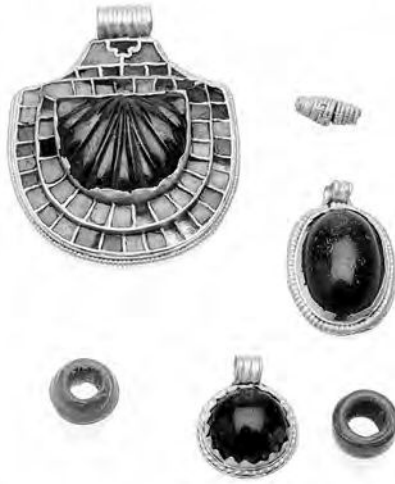
Hangars van goud en granaat uit graf 42, Street House, Loftus.

granaat in de vorm van een jakobsschelp van bijna 2 centimeter breed. Iets dergelijks was nog nooit gevonden en het suggereerde dat de in graf 42 geëerde persoon erg belangrijk was – waarschijnlijk iemand uit een koninklijke familie of de adel. Het suggereerde ook dat ze een vrouw was. 8