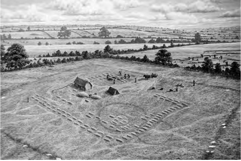
Reconstructie van de zevende-eeuwse site in Street House, Loftus door Andrew Hutchinson. © Andrew Hutchinson en Stephen Sherlock

van vele eeuwen oud. Stenen van oude Romeinse structuren liggen verspreid en een paar nieuwe houten gebouwen verrijzen tussen grafheuvels en verhoogde greppels.