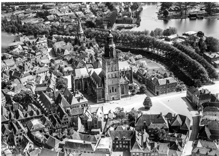
Het gymnasium van Zutphen, op de hoek rechts naast de kerk.