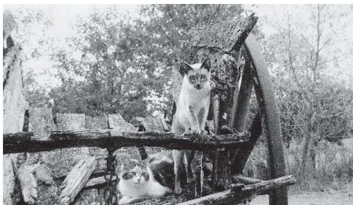
Pico en Bello

kon ik net zo goed thuisblijven. Een mooi landschap telt voor mij niet als de zon er niet op schijnt, dus het moest onder het reengebied van de Loire liggen. Het moest er niet te toeristisch zijn, pseudoniem voor: er moeten niet al te veel Nederlanders zitten. Het moest een mooi uitzicht hebben en de burens moesten niet al te hinderlijk aanwezig zijn.