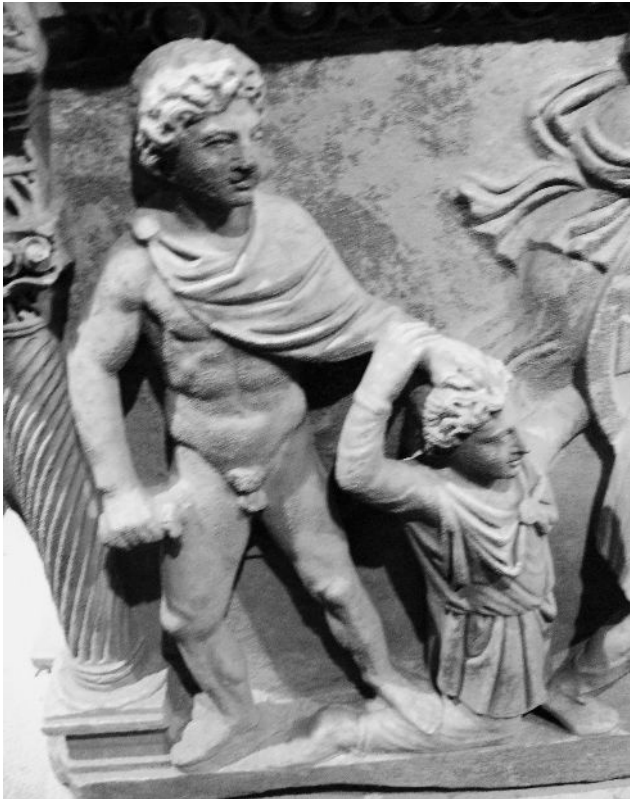
Odysseus slaat Thersites (afgebeeld op een Romeinse sarcofaag in het Museum van Antalya)

Dat ongetwijfeld ten uitvoer gebracht wordt. Indien ik U ooit weer Zó als ge nu aan het kijken waart, als een verdwaasde vind razen, Dan mag Odysseus het hoofd van zijn schouders verliezen; niet langer Heten Telemachus' vader, wanneer ik U niet uwe kleren Ruk van het lijf, uw mantel en chiton, bedekkend uw schaamte, En U niet jammerend weg naar de snelle galeien zal jagen, Uit de vergaading naar buiten geranseld met smaadlijke slagen. 2