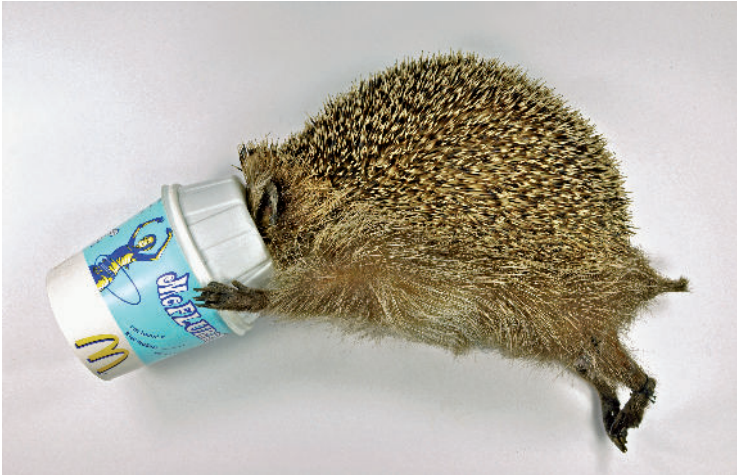
De McFlurry-egel uit 2007 werd opgezet met de ijsbeker die hem fataal werd.

Een van de weinige verslavingen die ik heb, is de McFlurry®. Dat is een vanille-ijsje waar ze (nog meer) zoetigheid op strooien en er vervolgens doorheen draaien, M&M's bijvoorbeeld. Heerlijk! Als ik in de buurt ben van een vestiging van de hamburgergigant die ze verkoopt, dan val ik ervoor. Ik heb deze zwakte lang voor me gehouden, maar nu kom ik ermee naar buiten vanwege 2009, het Jaar van de Egel.