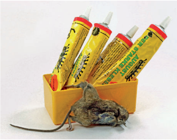
Bosmuis vastgeplakt aan lijmtubes, zoals aangetroffen in Keulen.