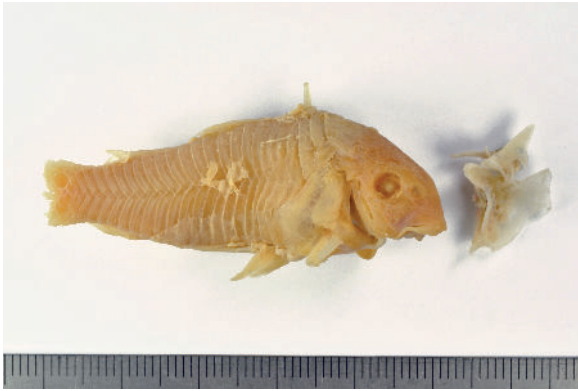
Pantsermeerval met de losse linkerborstvin, in het Erasmus MC verwijderd uit de keel van een 28-jarige man; schaalverdeling in millimeters.

Benoist had de vis in zout water bewaard. Die vloeistof vervingen Erwin en Ben direct door 70 procent alcohol, waarmee de Verslikvis deugdelijk en voor de eeuwigheid werd geconserveerd. Omdat de patiënt maar niet genas, nam de kno-arts nog een kijkje in de keel. De boosdoener bleek de linkerborstvin, die was achtergebleven. Dat stekelige skeletdeel werd ook zorgvuldig bewaard. De visslikker genas uiteindelijk na een week en gaf toestemming voor opname van de pantsermeerval in de museumcollectie. De man zelf wil anoniem blijven. Hij gaf aan ‘geen gedoe met dierenactivisten’ te willen, maar stelde wel een dramatische homevideo van het voorval ter beschikking aan de wetenschap. Mede op basis daarvan is een medisch case report voor kno-artsen samengesteld.