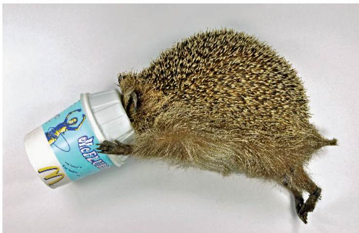
De McFlurry-egel uit 2007 werd opgezet met de ijsbeker die hem fataal werd.

Een van de weinige verslavingen die ik heb, is de McFlurry®. Dat is een vanille-ijsje waar ze (nog meer) zoetigheid op strooien en er vervolgens doorheen draaien, M&M's bijvoorbeeld. Heerlijk! Als ik in de buurt ben van een vestiging van de hamburgergigant die ze verkoopt, dan val ik ervoor. Ik heb deze zwakte lang voor me gehouden, maar nu kom ik ermee naar buiten vanwege 2009, het Jaar van de Egel.