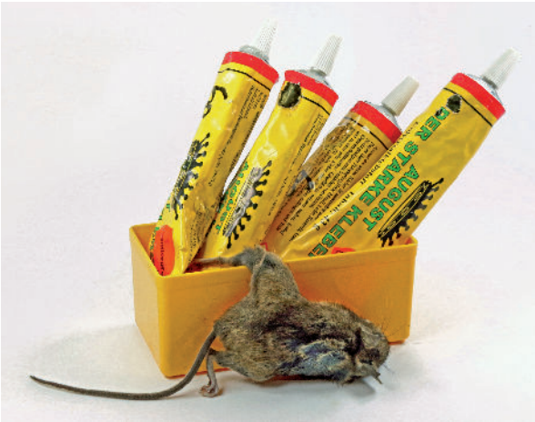
Bosmuis vastgeplakt aan lijmtubes, zoals aangetroffen in Keulen.