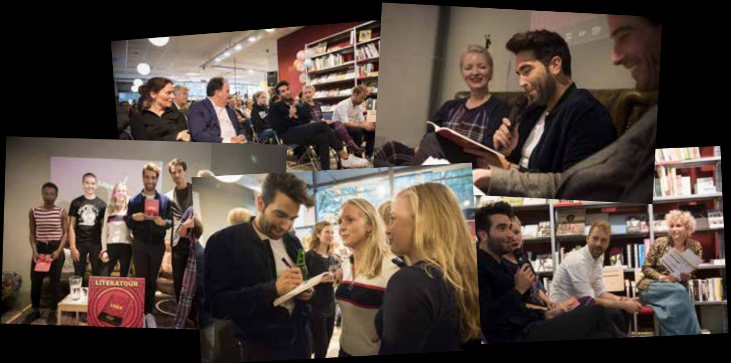
Literatuur 2017

D e drie gebroeders zagen het allemaal gebeuren. Een hoge wind blies van boven naar beneden op alle bladerpracht, waarna de bomen welwillend over het plein bogen, het ruisende geluid golfde over de Lutmastraat zo mijn oren in. Ik stelde mij de sterke wortels van de gebroeders voor, die als reuzenhanden met wijdverspreide vingers diep in de natte grond staken. Net zo diep als mijn gevoelens voor hen, dit plein en alles wat er gebeurd was op dit stukje speelplaats – de tijd had verdomd veel haast. De prachtige populieren waren de trouwe bewakers van mijn fijne jeugdherinneringen – die door alle jaren heen vast alleen maar onverschillige blikken vingen. Dat stak mij iedere dag. Dus iedere keer als ik ze zag, begroette ik ze met een eerbiedige hoofdbuiging, als goden die ik liefhad.